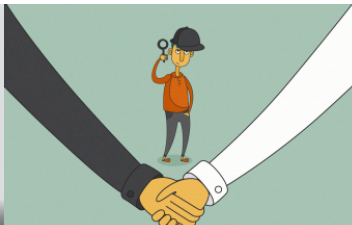
Karteliai viešuosiuose pirkimuose 2019 01 07