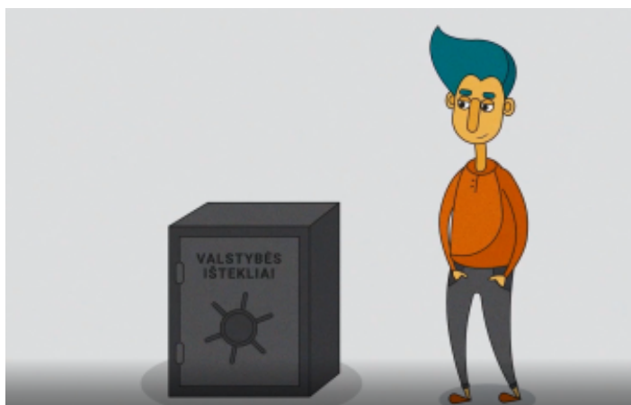
Valstybės pagalba 2019 01 07